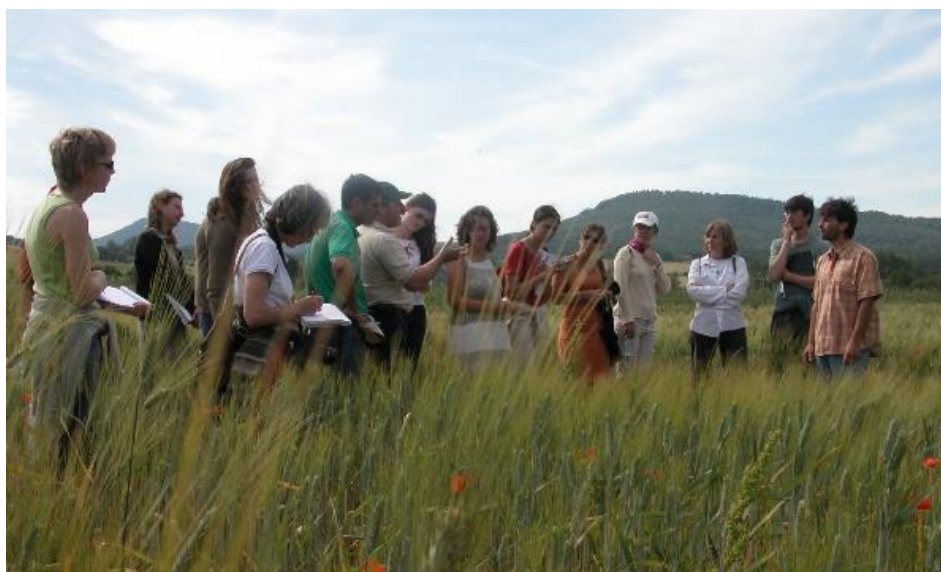
@Buy van Minh

Anticiper, formaliser et prioriser les questions de recherche nécessite la mobilisation forte de collectifs pluridisciplinaires et multi-partenariaux dans le cadre d'approches résolument participatives et ouvertes à une diversité d'acteurs.